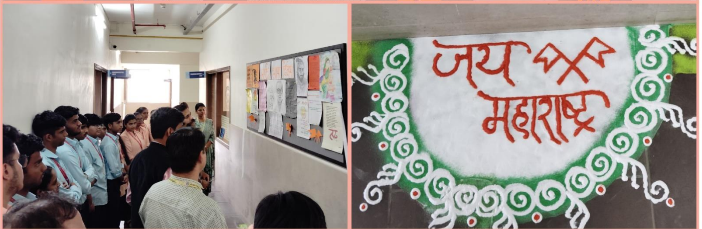
B. Pharmacy & D. Pharmacy Participants in Marathi Kavita & Art presentation