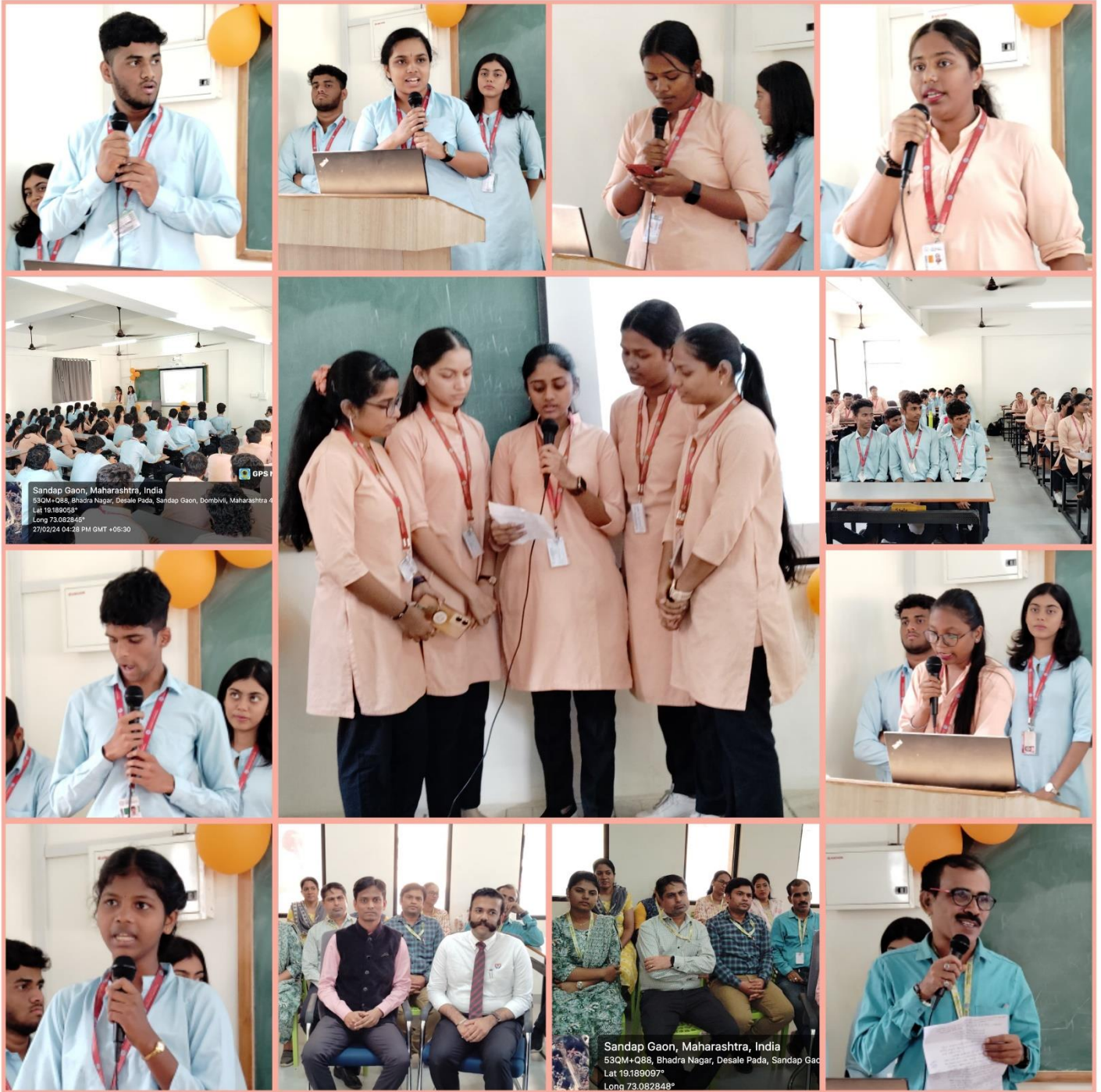
Presentations by the students at seminar hall on account of Marathi Bhasha Gaurav Din